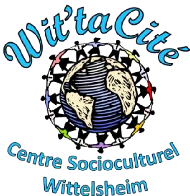
Logo du Centre Socioculturel Wit'taCité

Au fil des déménagements, des changements et des nouveaux agréments délivrés par la PMI, la crèche « Kalinours » a connu une croissance importante : de petite halte-garderie, elle est devenue une grande crèche, accueillante et fonctionnelle. En 2023, elle compte 16 salariées et propose un mode de garde pour environ 130 familles de la ville de Wittelsheim et de la M2A (Mulhouse Alsace Agglomération) dont elle fait partie.